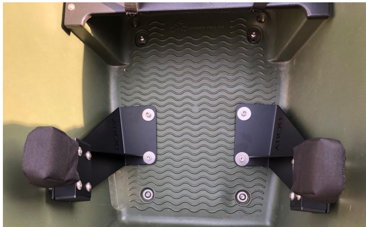
Maxi Cosi houder Deluxe montage